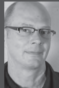
Joseph Guy Hamiter Beratung | Auftragsannahme