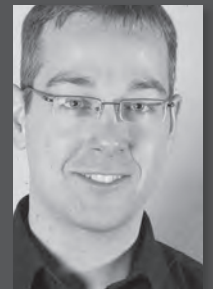
Dirk Klöpfer Beratung | Auftragsannahme

Wissinger GmbH . Vorderer Aischbach 3 . D - 72275 Alpirsbach Tel. +49 (0) 74 44 / 9 56 16 - Fax +49 (0) 74 44 / 9 56 166 www.wissinger.de . info@wissinger.de